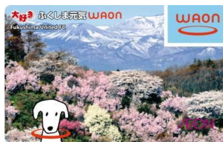
大好きふくしま元気WAON